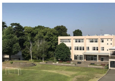
【新田の杜・一号館】