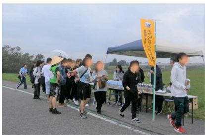
【チャレンジウォーク】